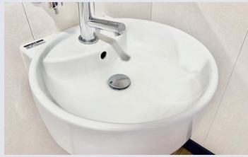
身の回り品の除菌