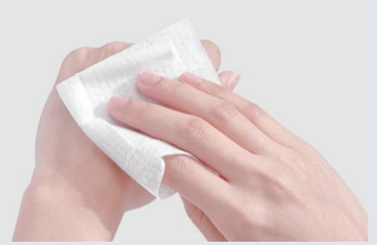
緊急時のお手ふき